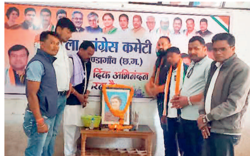
कोण्डागांव। कांग्रेस भवन में देश की प्रथम महिला प्रधानमंत्री आयरन लेडी स्व इंदिरा गाँधी की जयंती श्रद्धा भाव से मनाई गई।